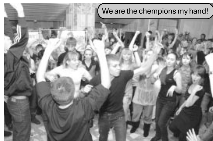
We are the chempions my hand!