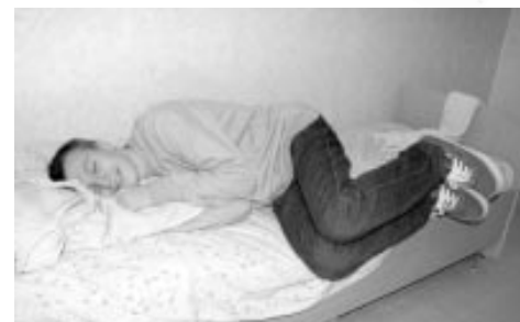
Спят усталые Дениски в башмаках...