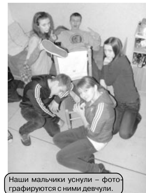
Наши мальчики уснули – фотографируются с ними девчули.