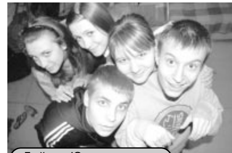
«Дайте «Юнкора года»... Пожа-а-алуйста!»