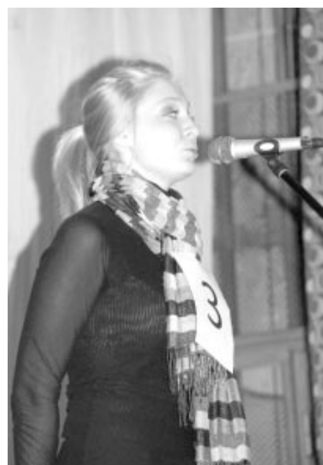
Ангелина Коврижных. Кандидат в президенты России №3.