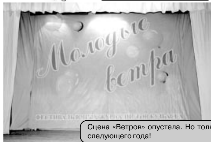
Сцена «Ветров» опустела. Но только до следующего года!