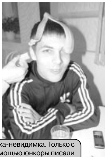
Шкурка-невидимка. Только с её помощью юнкоры писали отличные материалы.