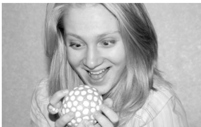
В «Сказке» еда сказочно вкусная, круглая, яркая и... дырявая.