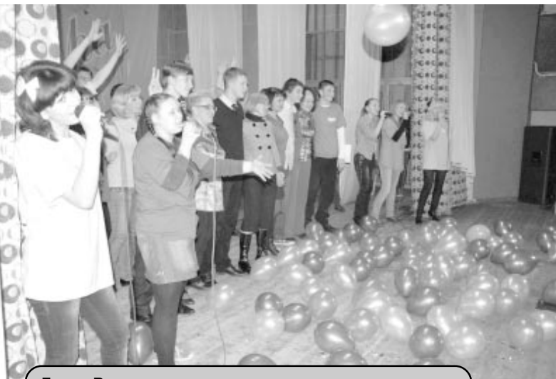
Гимн «Ветров» исполняли даже воздушные шары.