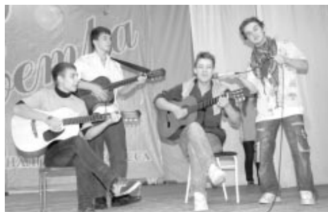
Молодцы добрые песенки славные для исполняют.