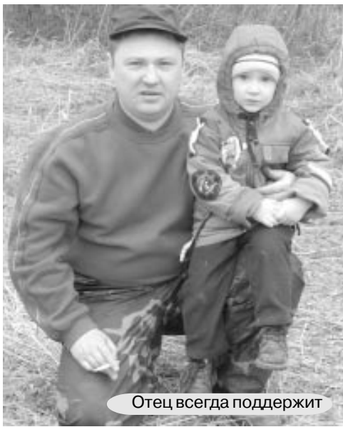
Отец всегда поддержит

Шло время, ребёнок вырос, но отец всегда был эталоном для подражания. Все, что не поддавалось маленьким неумелым рукам, малыш просил сделать папу. Казалось, он умеет делать всё на свете. Забить гвоздь, порубить дрова, достать котёнка с дерева – всё это для отца было обычным делом, а в глазах сынишки выглядело,