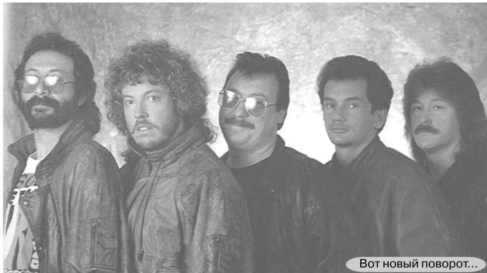
Вот новый поворот...

планы, я сумела быстро собраться с мыслями, и не долго думая, отправилась на улицу.