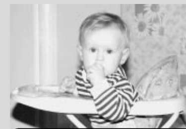
Автор: Анастасия Кочалкова

В детство отправлялась Екатерина Герасимова