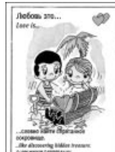
Любовь – это... жвачка

ная манная каша – во всяком случае, мне так всегда казалось. Странное чувство: кажется, ты просто закрыл глаза и вспоминаешь. Только меняющиеся перед глазами картинки в 4D формате: их можно потрогать и даже почувствовать. Несколько мальчишек с довольными лицами за спинами воспитателей возятся в грязи, девочки в стороне хвастаются друг перед другом новыми наклейками из журналов «Barbie». Ещё пару человек с оранжевыми ртами, спрятавшись за железным «паровозом», едят сухой напиток «Yupi». Мой же взгляд остановился на одной маленькой девочке в красной курточке, которая аккуратно пыталась что-то вытащить из кармана. Подойдя поближе, я увидела в руках у ребёнка завернутый в платочек тамагочи – электронного питомца. Девочка ласково поглаживала игрушку, интересуюсь: не замёрз ли её любимый «зверь». Помните, и у меня в детстве был такой электронный друг, и я так же закутывала его перед выходом из дома, боясь, что он простудится.