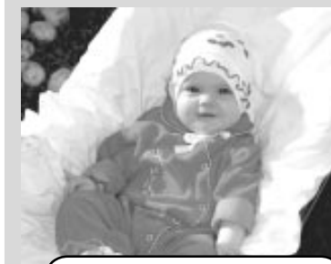
Автор: Ксения Сажина