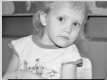
Автор: Анастасия Кочалкова