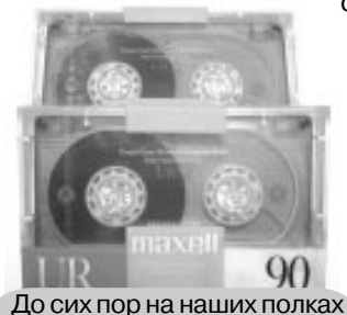
До сих пор на наших полках

Не обращая на меня никакого внимания, молодой человек натягивает на себя потрёпанные джинсы и футболку. В этих кудряшках и очках я узнаю своего папу, совсем не похожего на отца взрослой дочери. В этот момент один из