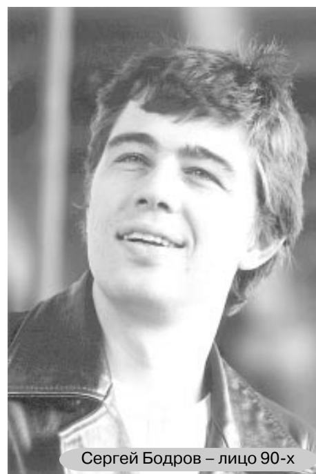
Сергей Бодров – лицо 90-х

молока. В этот тяжёлый год для народа порадовать семью вкусным и богатым столом было довольно сложно. Так и незамеченной никем из жителей этой квартиры возвращаюсь обратно в папину комнату, беру первую попавшуюся книгу с полки, падаю на кровать и погружаюсь в чтение.