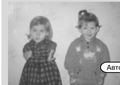
Автор: Мария Гвоздева