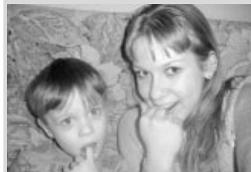
Автор: Даша Семенюта