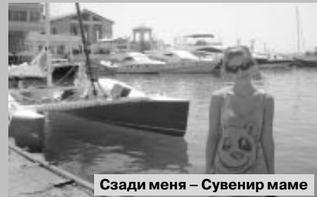
Сзади меня – сувенир маме

На второй день моего приезда мы отправились на Чёрное море. Сочинские пляжи очень многолюдны. По берегу бродят негры, предлагают сделать фото на память, дети надувают круги, кто-то закапывает ноги в песок. Пришлось