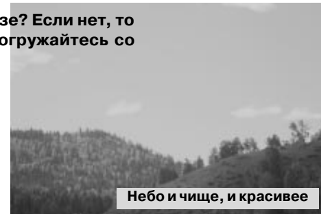
Небо и чище, и красивее

Мы разделились на группы: одни стали разбивать палаточный городок, другие начали жарить шашлыки, а остальные пошли рыбачить, в их числе был я. Поняв, что с берега не очень удобно закидывать