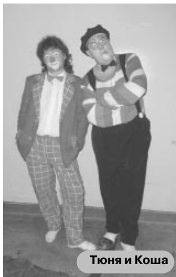
Тюня и Коша

Тогда и жизнь будет ярче. Пусть люди чаще приходят в цирк, смотрят на таких дяденек, которые ещё из детского возраста не вышли, тогда и нам легче работать будет, ведь скучно в пустом зале веселиться и веселиться.