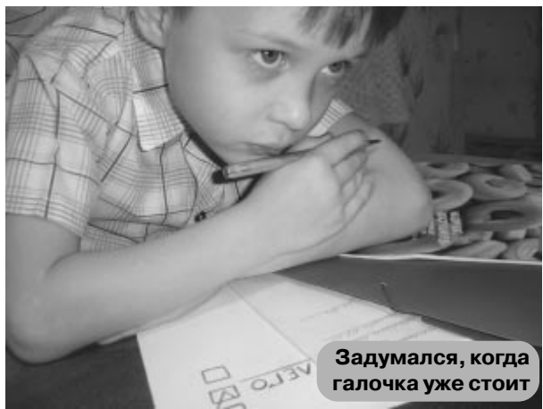
Задумался, когда галочка уже стоит

так и проходил в том же духе. Поехав на вокзал встречать подружку, я сломала каблук на новых туфлях. И дело вовсе не в моей спешке, а в том, что именно на том перекрёстке шёл ремонт дорог, и пешеходный