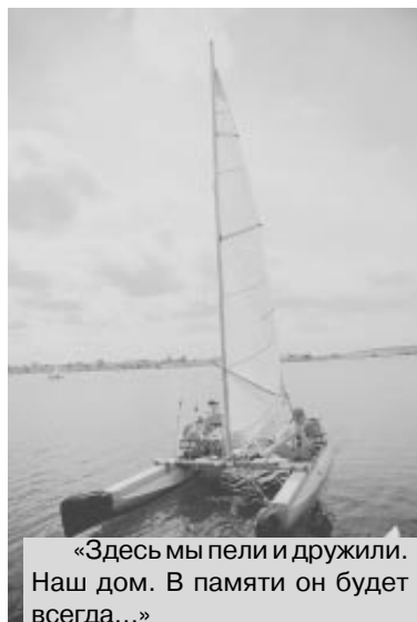
«Здесь мы пели и дружили. Наш дом. В памяти он будет всегда...»

Во второй и третий день всех ожидали учебные программы: такелаж, правила расхождения судов, техника безопасности, медицинская помощь. На третий день уже могут начать катания на бублике (бублик – это небольшая надувная штука, которая привязывается к моторной лодке, вроде «банана», только для двоих). Четвёртый день – са-