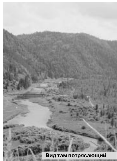
Вид там потрясающий